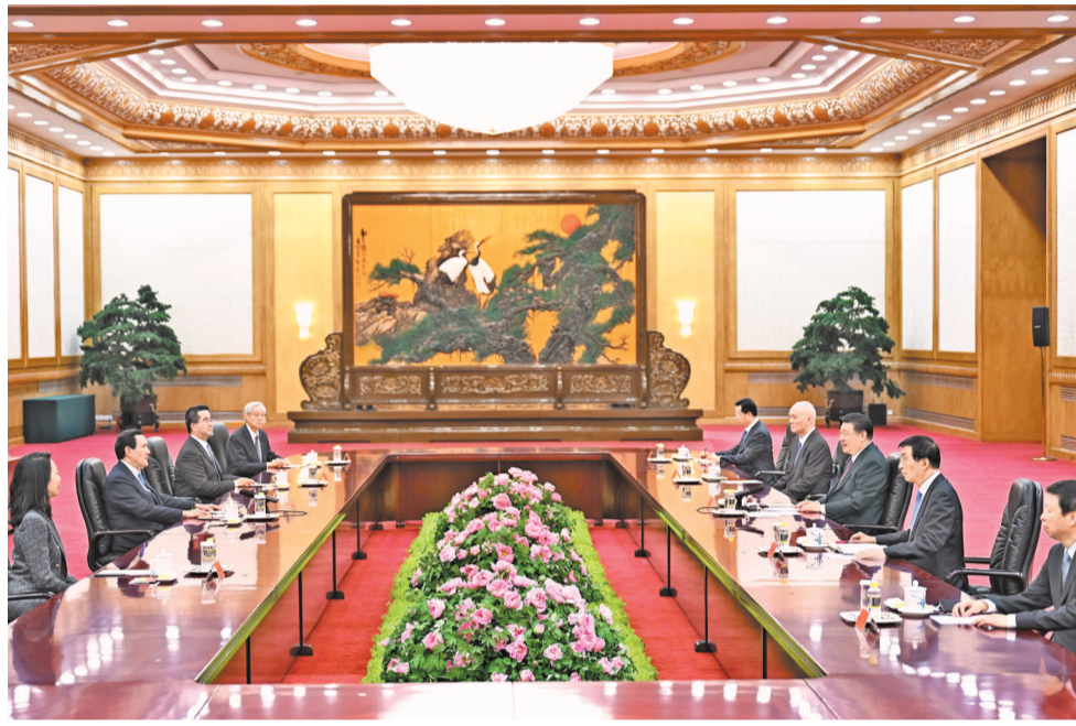
4月10日下午，中共中央总书记习近平在北京会见马英九一行。