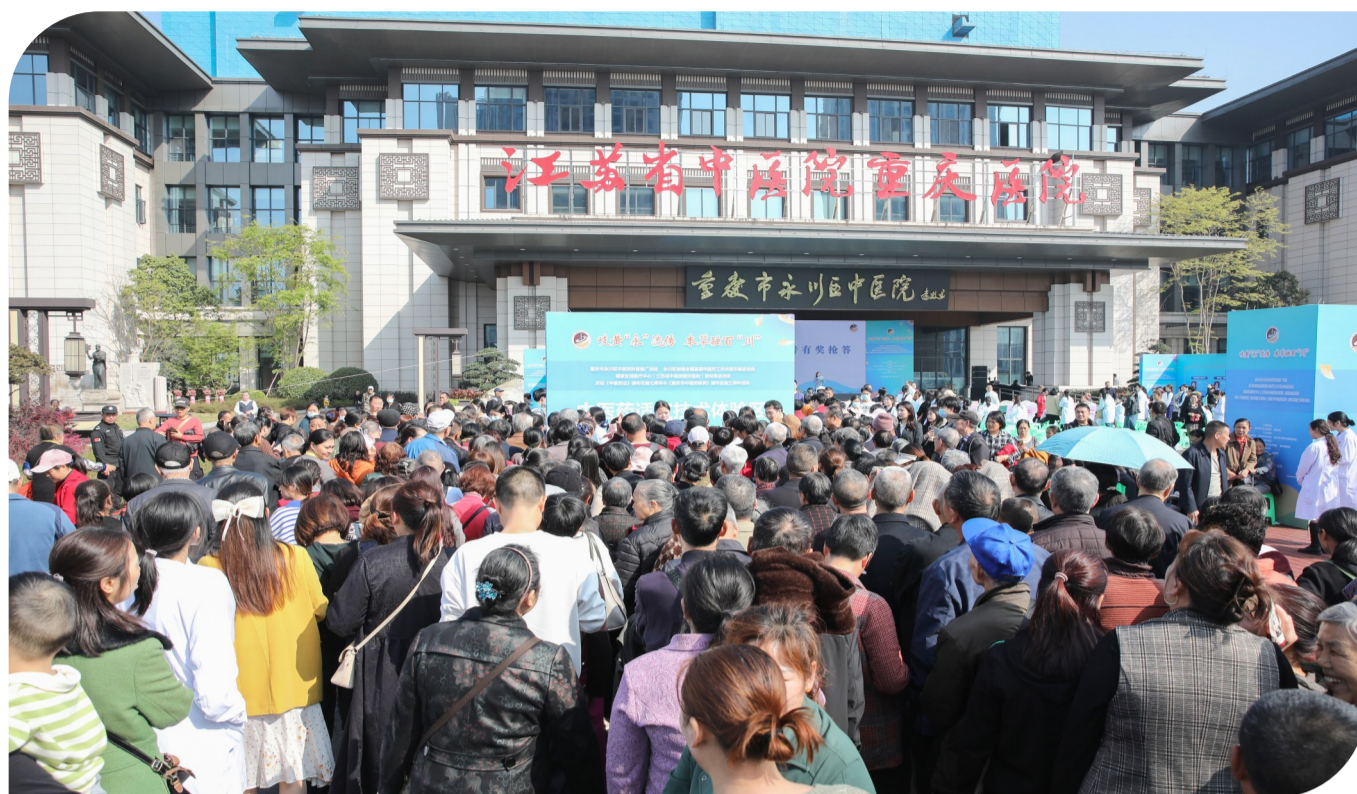
永川区中医药科普推广系列活动现场

据悉,永川区卫生健康系统正积极开展“全国基层中医药工作示范市”创建工作,江苏省中医院重庆医院(重庆市永川区中医院)作为龙头单位,将认真贯彻落实中医药工作方针政策,加强中医药服务体系建设,做好对全区基层医疗机构开展中医药业务的指导等工作,充分发挥医院的辐射带动作用。