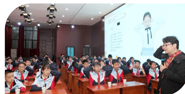
中医药文化活动现场

未来,医院将通过形式多样的文化传播覆盖,多管齐下的文化建设保障和成果转化,提升中医药文化的凝聚力、影响力和竞争力。