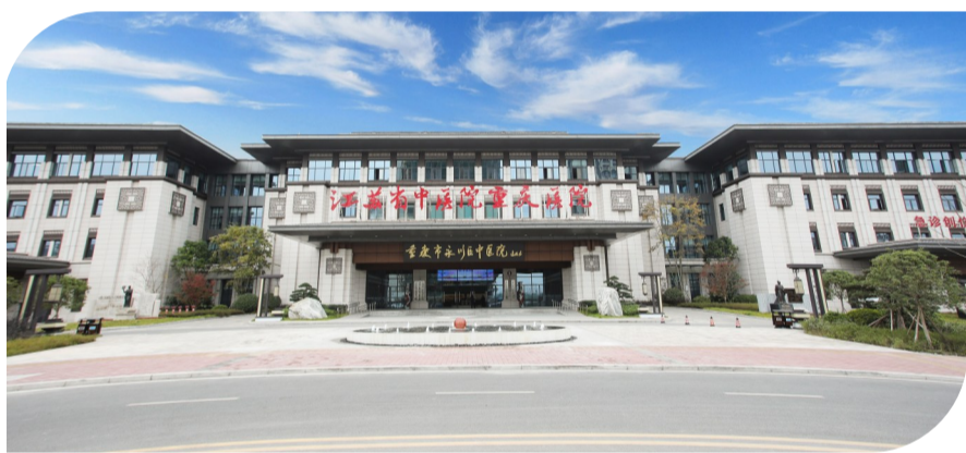
江苏省中医院重庆医院(重庆市永川区中医院)