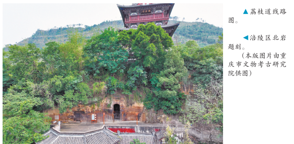
▲荔枝道线路图。 ▲涪陵区北岩题刻。