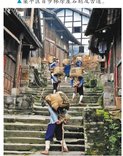
▲石柱自治县西沱云梯街。