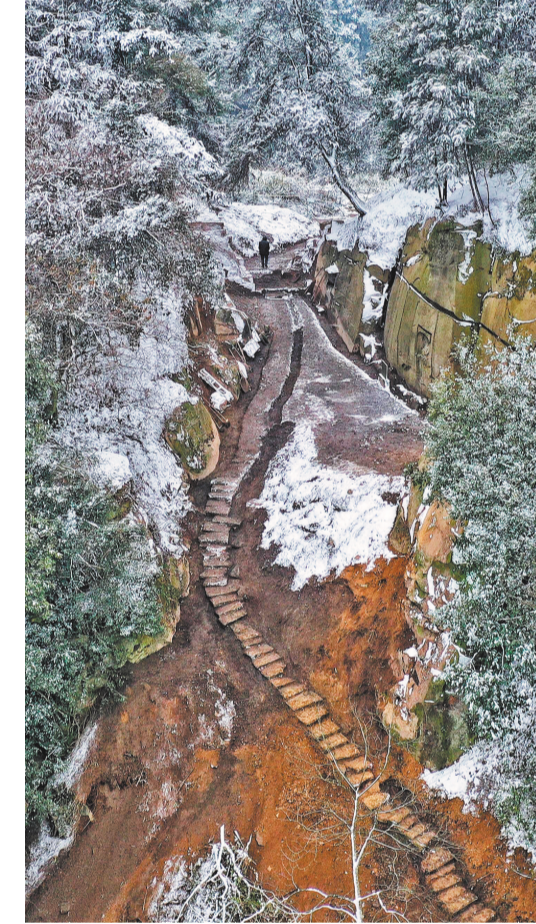
▲垫江县峰门铺埋口。