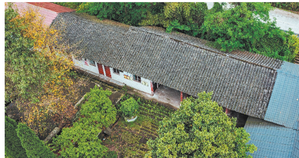
▲长寿区罗园老街民居。