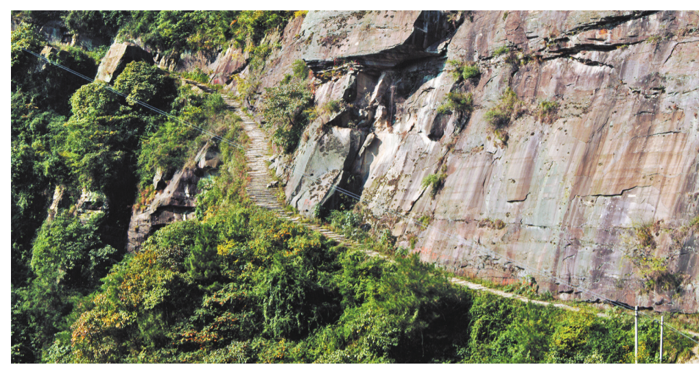
▲万州区万梁驿道孙家段。