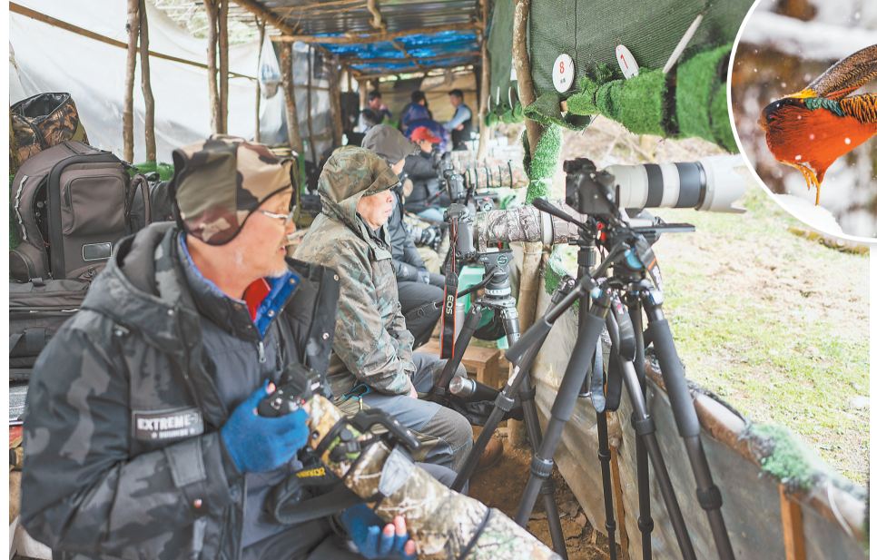
▲国家二级保护野生动物红腹锦鸡。

3月24日，梁平区铁门乡长塘村，经过外风貌改造的农房错落有致地镶嵌在田野间，在雪白樱花的映衬下更加美丽。 近年来，该区因地制宜、分类施策，持续推