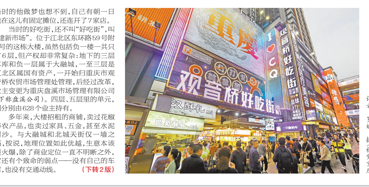
江北区观音桥好吃街已成为新地标,食客络绎不绝。

丁家坡洋芋、刘酥肉、葡萄井凉粉……江北区观音桥好吃街,每天上午10点到晚上11点,食客络绎不绝从四面八方涌来。 经营面积不足1.2万平方米的美食街,每天至少迎客11万人次,今年春节期间,人流更是高达130多万人次。放眼全国各大好吃街,它也是排名前列的“人气王”。 谁能想到,就在13年前,好吃街所在的这栋建筑,还是黑咕隆咚的烂尾楼。一楼、二楼稀稀落落的五金店和建材店,白天不开灯的话,只能“打黑摸”,库房里更是积了厚厚一层灰…… 从“烂尾楼”到“人气王”,背后是一段国有资产盘活艰辛历程。当下,全市上下正全力推进“三攻坚一盘活”改革突破,从观音桥好吃街的涅槃之路,我们或许可以获得一些经验和启发。