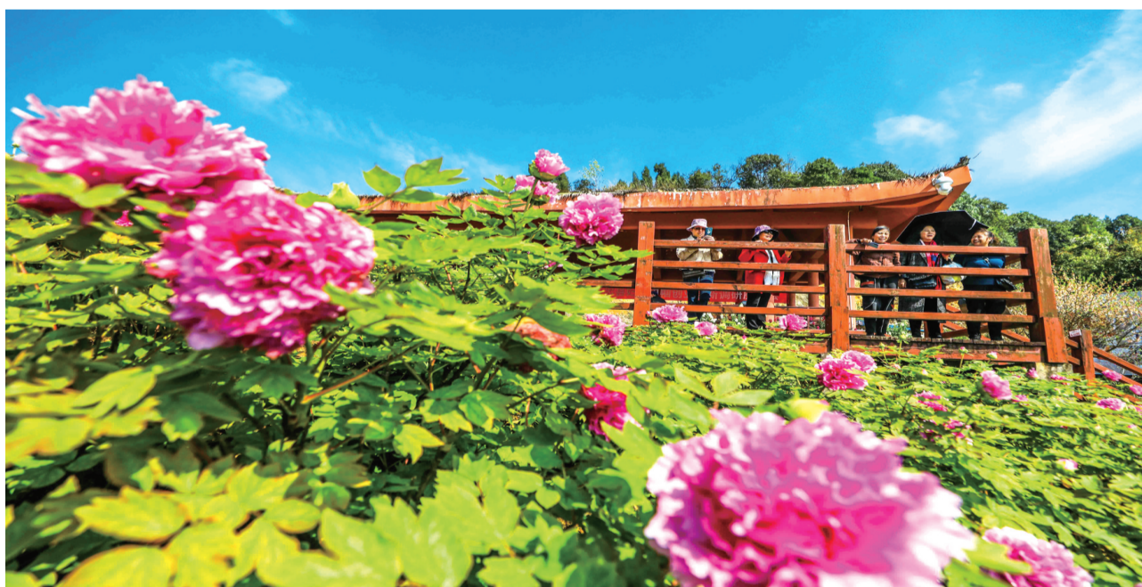
华夏牡丹园

已连续举办24年的牡丹文化节,不仅是垫江弘扬优秀文化、促进产业融合、拉动文旅消费、惠及广大群众的重要平台,更是垫江大力推动农文旅产业高端化、精品化发展的一张靓丽名片。近年来,垫江以做细做精“花文章”为契机,积极融入“大都市”旅游,借力借势“大三峡”旅游,围绕建设全国山水牡丹旅游胜地,探索“节俭经济”新模式,做响做靓“牡丹故里·康养垫江”旅游品牌,大力发展“慢生活、微度假、深体验”旅游业态,不断做大做强“花经济”,赋能现代化新垫江建设。如今的垫江吸引力、辐射力不断提升,打造市民近郊休闲旅游重要目的地渐行渐近!