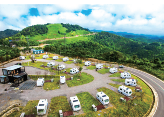
闲云茗居露营地