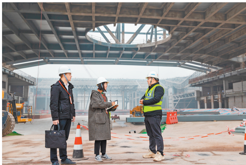
▲在成渝中线高铁施工现场，由重庆市大足区纪委监委选派的纪检监察干部，对项目施工进度、安全生产责任落实情况开展监督检查，现场指出并督促整改存在问题。