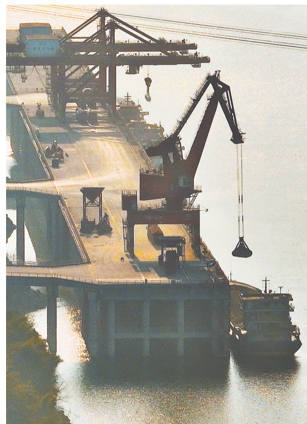
▲3月14日，涪陵龙头港正在进行散货吊装运输。