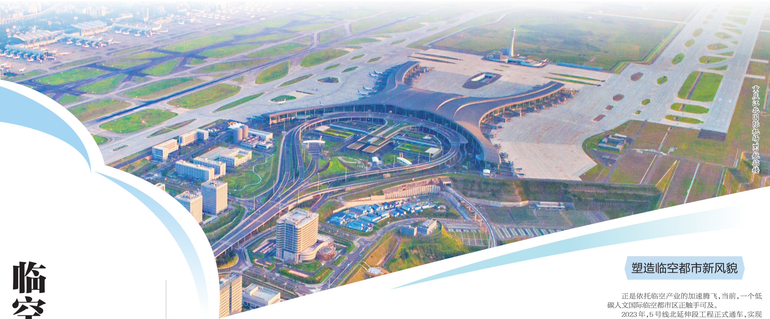
重庆江北国际机场T3航站楼