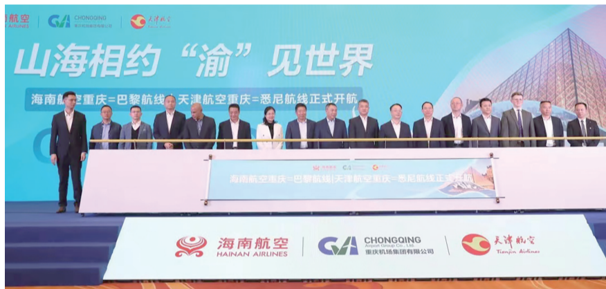
海南航空重庆分公司揭牌运营,渝北“牵手”海航打造临空开放高地

城市道路高效衔接,主干道通车里程达1370公里,轨道交通运营总里程约160公里,特别是随着4号线、9号线、10号线相继开通,机场东北部城市路网加速建设,周边城市交通网络系统大幅改善。