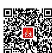
2024 重庆 春季义务植树 地图 扫一扫 就看到

据悉，近年来，我市加大森林抚育力度，精准提升森林质量和面积。截至目前，全市森林覆盖率达55.06%，森林蓄积量达2.74亿立方米。