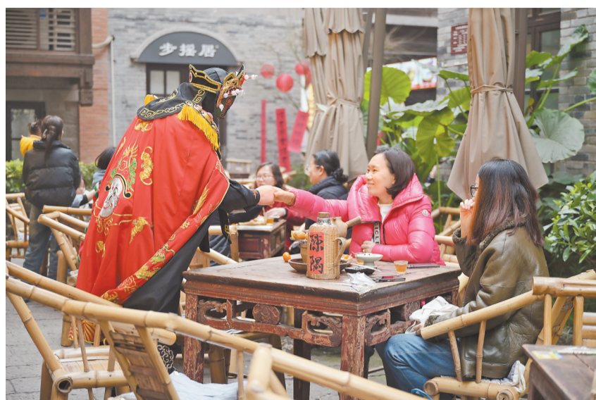
3月6日，陈隅茶铺《川剧变脸》表演过程中，演员与顾客互动。

从西部的成都，调研到东部沿海的苏杭、汕头等城市。 调研之后，在二人的心里，茶铺的定位逐渐清晰：保留老茶馆的烟火气，主打“新场景、新服务”，让喝茶成为重庆传统文化体验地，成为年轻人的一种新生活方式。