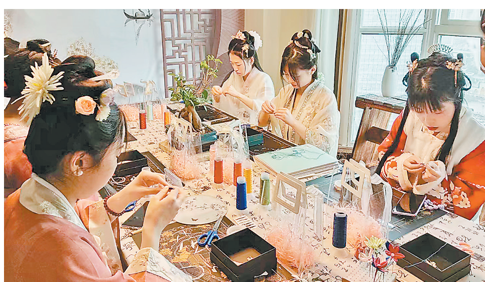
顾客在国风体验馆亲手制作“缠花”。