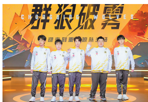
重庆狼队是主攻“王者荣耀”的顶流战队。