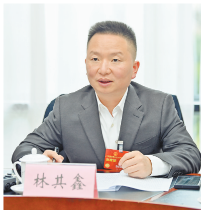
林其鑫 首席记者 龙帆 摄/视觉重庆