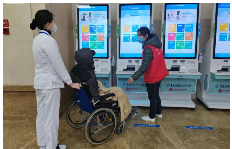
“门诊助医”和志愿者为腿脚不便的老人提供服务

服务层面,医院不仅提供了便捷的预约方式,还设立了老年人“绿色通道”,确保特殊老年群体能够优先得到治疗。同时,扩充志愿者队伍和“门诊助医”为老年患者提供了引导、解释等贴心服务,“病房管家”也为老年患者提供了心理疏导、生活陪伴、专科疾病科普等服务,使他们在就医过程中感受到家一般的温暖。 重庆市第七人民医院在老年友善服务方面的深度践行,不仅彰显了医院的专业素养和人文关怀,也为社会的和谐发展注入了正能量。2023年,医院被正式命名为“重庆市老年友善医疗机构”,这既是对医院过去努力的肯定,也是对其未来工作的期待。