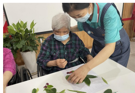
指导老人进行手部功能锻炼

务,精心打造让老人健康康有尊严、舒舒服服有品质的社区医养服务。同时,重庆中粹护理院还利用中粹智慧养老系统,通过政府购买服务、长期护理保险、养老服务人才培养等提升居家养老服务质量,并提供包括居家上门、居家托养、居家医养、远程会诊、健康管理等服务。