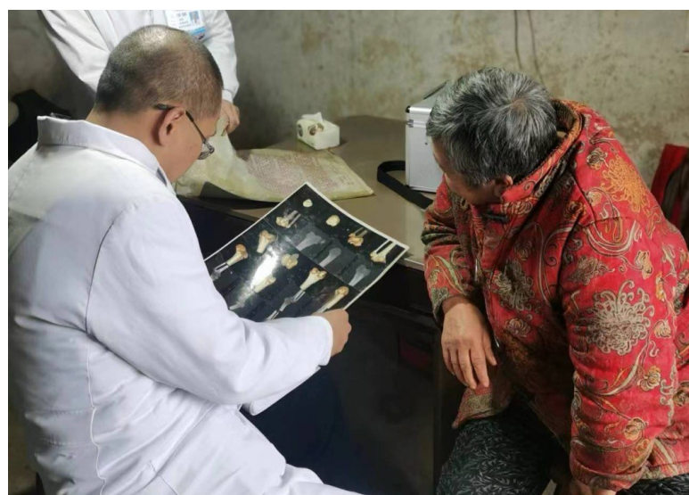
医务人员上门开展入户入户护险评

南区人民医院则借助“互联网+服务”,为老年人提供在线咨询、在线问诊、在线开药、送药到家等服务,同时根据线下需求按需指派医护人员入户提供康复训练、护理、心理疏导等服务,让老年患者足不出户即可享受所有服务。 巴南区人民医院相关负责人表示,下一步,医院将担当起紧密型城市医疗集团牵头医院的责任,建立胸痛、卒中、创伤、咯血、危重孕产妇救治、危重儿童和新生儿救治急救六大中心,围绕“养、护、医、康、照、救”六字工作方针,实现全生命周期健康管理及医疗救治,高品质推进区域内医养结合工作。