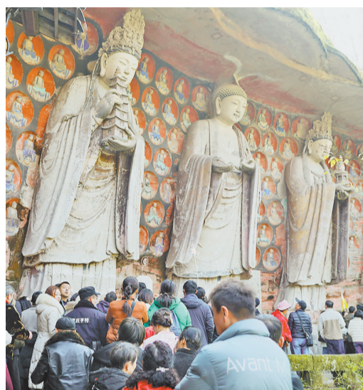
▲2月11日,大足区宝顶山石刻景区,前来参观世界文化遗产大足石刻的游客络绎不绝。