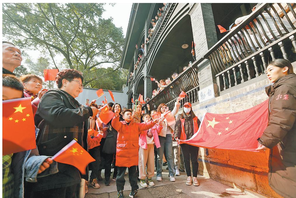
▲2月12日,沙坪坝白公馆,千余游客挥舞五星红旗激情高歌《歌唱祖国》,表达对革命先辈的崇高敬意。