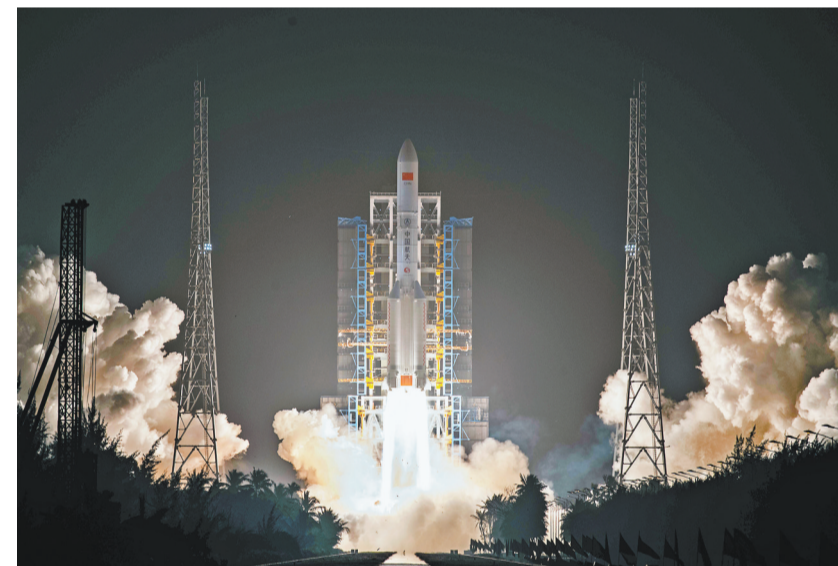
2月23日19时30分，我国在文昌航天发射场使用长征五号遥七运载火箭，成功将通信技术试验卫星十一号发射升空，卫星顺利进入预定轨道，发射