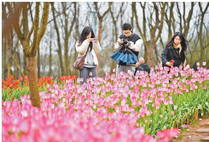
▲2月21日，长寿湖景区，满园郁金香进入观赏期，游客冒雨赏花。