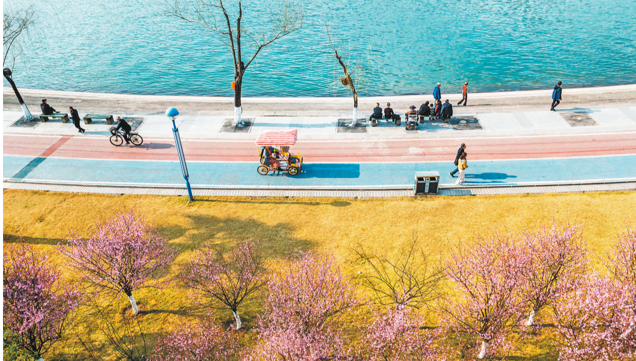
▲2月20日，开州区滨湖公园，美人梅竞相绽放。