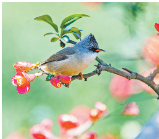
▲2月22日，南岸区南山街道涂山湖畔，一只黑颏凤鹛在怒放的海棠花枝头停留。