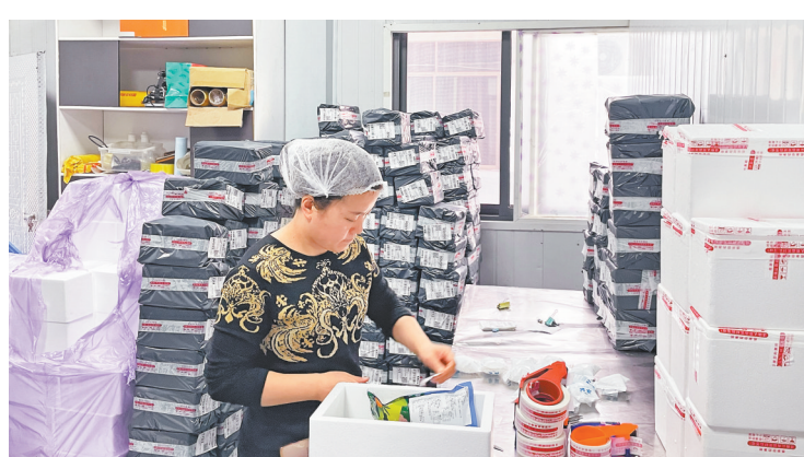
斤多凉拌儿菜来计算,公司每天要加工1万斤左右的新鲜儿菜,量不算小。

今年春节刚一过完,渝香味公司便实现了满负荷运转,每天销售约400单、1000多斤“春日儿菜”。按照10斤新鲜儿菜加工1