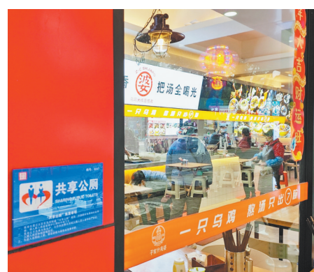
▲石马河街道鼓励社会公厕加入“共享公厕”。

在补齐社区服务、设施短板的同时,石马河街道也在思考将“由我做”变为“共同做”的问题,拓展居民参与社区治理的制度化渠道,成为街道提升治理效能的创新实践。