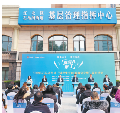
▲1月11日,石马河街道“谋民生之利解群众之忧”发布活动举行。

文聚苑社区石油怡秀小区部分房屋建于上世纪70年代,因年久失修,许多阳台存在重大安全隐患,个别阳台甚至出现垮塌差点伤人的情况,让社区不放心,居民很揪心。可当小区打算实施改造“手术”时,居民们却吵翻了天。