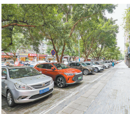
▲2月22日,江北区盘溪三支路,整改后的道路路面整洁,停车有序。

石马河街道拆迁安置小区多,由于历史原因和设计缺陷,地下停车位资源很少。随着片区机动车辆增多,停车供需矛盾越发突出。