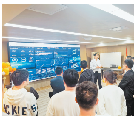
▲石马河街道养老服务中心开展“智慧养老云平台”培训。

除了改善硬件设施,社区服务也是提升基层精细化治理的重要内容。石马河街道针对辖区老人较多的情况,以智能养老试点为突破口,推动社区服务升级。