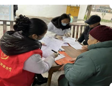
家庭医生为居民签约现场

此外,九龙坡区二郎街道社区卫生服务中心还为市民群众提供常态化、多样化的利民惠民活动,持续开展了“优服务、暖民心、保健康”义诊活动,家庭医生到了“好儿郎”义诊义诊关爱行动等主题宣传活动,利用“二郎百姓”呼叫台做好卫生政策的解读,努力营造人人知晓、人人支持、人人重视的浓厚氛围。