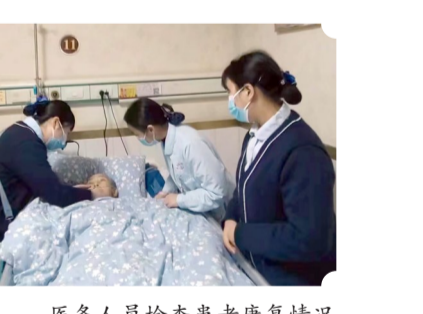
医务人员检查患者康复情况

疾病为中心转化为以病人为中心”的理念,按照“党政主导、部门联动、社会参与、协调共建”的工作思路,把安宁疗护纳入专科发展,通过设置独立的病区,制定明确的准入标准、服务规范、实践指南,邀请国内知名专家来区开展安宁疗护实践交流活动,提升医务人员的专业技能。自安宁疗护试点工作开展以来,已累计为500余名临终患者提供安宁疗护服务,患者及家属满意度达100%。