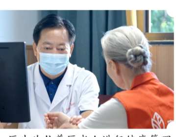
医生为住养区老人进行健康管理

此外,九龙坡区宏善康乐源养护中心与九龙坡区人民医院、九龙坡区中医院建立合作关系,通过协议合作、转诊合作等方式,为机构老年人提供优先就医待遇,确保他们得到及时有效的医疗救治。