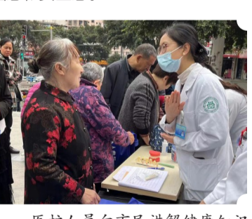
医护人员向市民讲解健康知识

未来,九龙坡区石桥铺街道社区卫生服务中心将以成功创建“重庆市老年友善医疗机构”为契机,持续推进医院老年服务的全面提升,继续弘扬老年友善文化,切实增强辖区老年人获得感、幸福感和安全感。