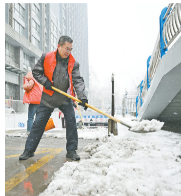
2月4日,在合肥市包河区芜湖路街道兰亭社区,社区工作人员在清扫路面积雪。