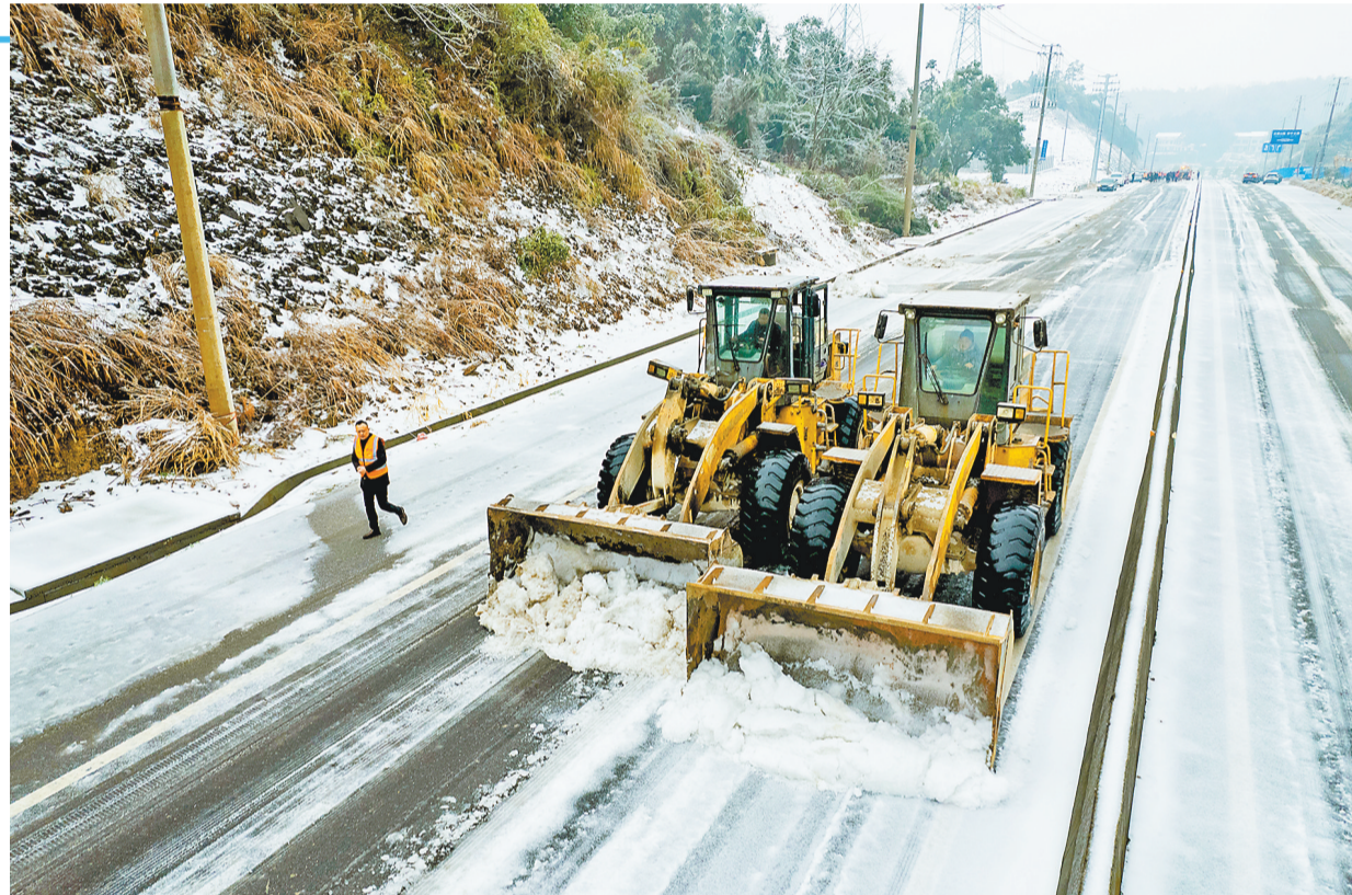
2月5日,在位于湖南省益阳市桃江县境内的S230桃江段,桃江县公路局工作人员调用除冰车铲除道路上的冰雪。