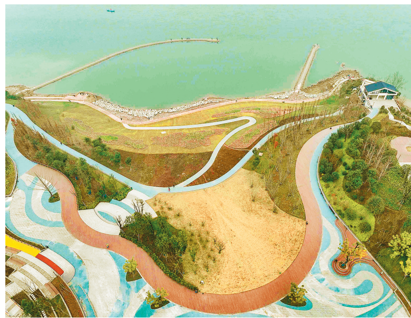
2月1日拍摄的北碚区白鱼石公园局部，地形犹如一个半圆形“剧场”。

目前，在两江协同创新区范围内，除了271台科研设备，还有900多盏路灯、2700多个摄像头、50栋楼、10个停车场已接入智慧园区系统，实现统一管理和运营。下一步，智慧园区系统将覆盖更多的建成楼栋和区域，提升明月湖畔的“智慧”含量，让园区的创新创业创业者能够享受智慧化的生产生活方式。