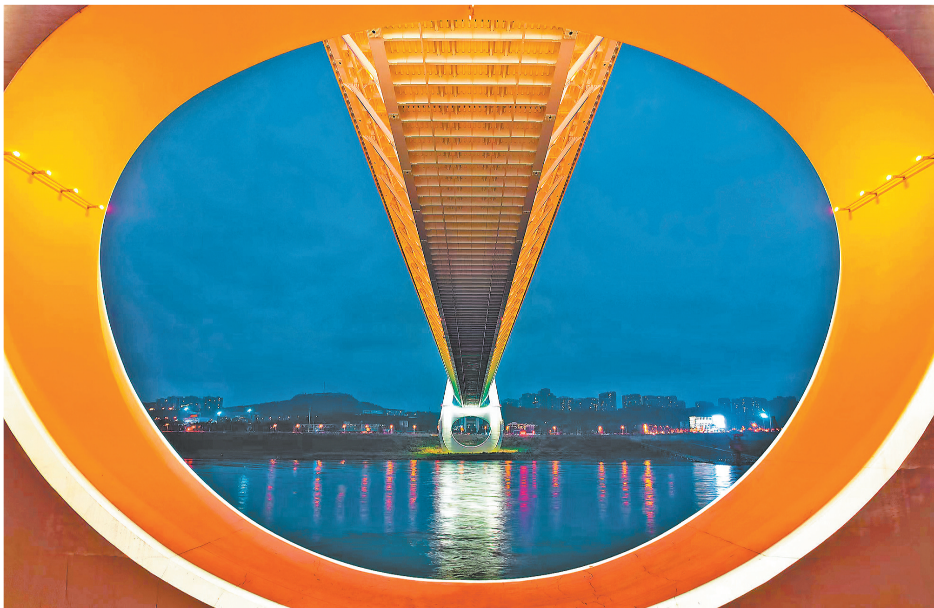
▲近段时间，白居寺长江大桥因“星际穿越”般的场景火爆“出圈”，成为重庆最热门打卡地之一。