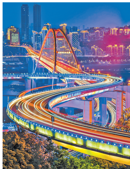
▲流光溢彩的菜园坝长江大桥及苏家坝匝道。