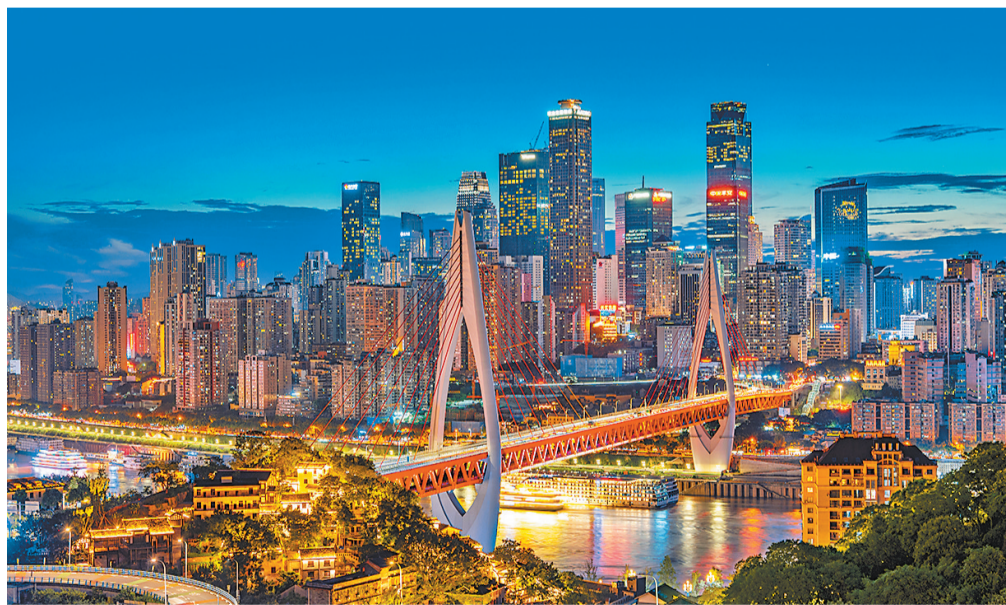
▲连接渝中区与南岸区的东水门长江大桥，从不同地方眺望，皆成风景。