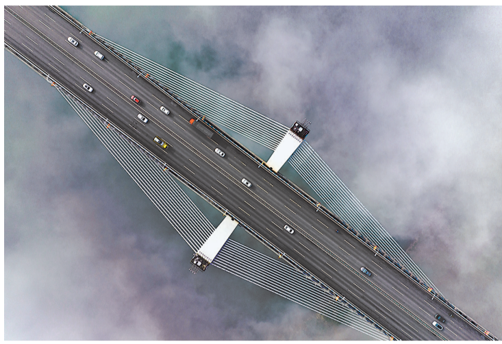
▲造型别致的嘉悦嘉陵江大桥，在薄雾映衬下更显优雅。