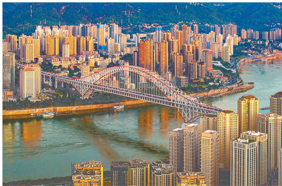
▲如彩虹般美丽的朝天门长江大桥，是重庆著名地标建筑之一。