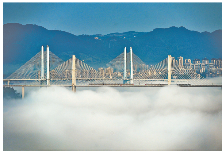
▲建成不久的蔡家嘉陵江大桥和蔡家轨道大桥，如今已是交通要道。