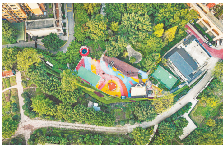
俯瞰渝钢社区打造的新公园。