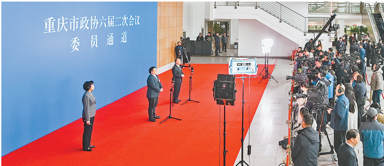
1月22日，人民大厦，重庆市政协六届二次会议“委员通道”集体采访活动现场。

通道不过数米，却是展示对外形象的又一重要窗口，彰显出新重庆的开放、透明、自信。委员们铿锵的话语，传递着新重庆发展的向好势头，凝聚着奋勇前行的决心和信心。