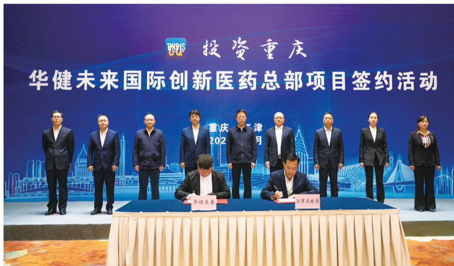
华健未来国际创新医药总部项目签约落户江津双福工业园

比如,制造业稳中有进,重汽轻型汽车F平台技术改造项目完成总装生产线设备安装,龙煜铜管、嘉利建桥等30家企业通过加大技术改造不断提高生产效率;自行者科技、航航科技等24家企业成功认定为“专精特新”企业;战略性新兴产业加速落地,春辉、克维斯等17个项目开工建设,柏力开米、快速成型样件制作及技术服务项目等6个项目建成投产;服务业提质增效,重庆西部(东盟)农产品冷链分拨中心项目持续做实做强,爱琴海、吾悦广场等商业综合体消费提升行动与夜经济商业