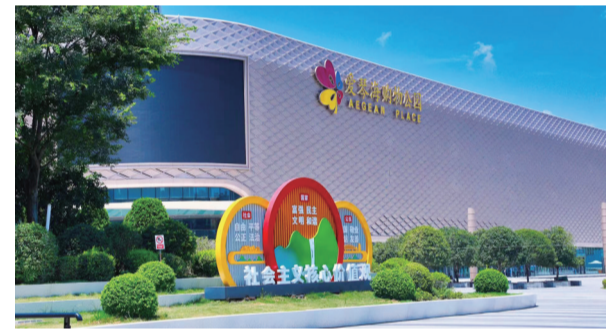
集科技与城市美学为一体的爱琴海购物公园

2024年,园区将聚焦服务国家重大战略和全市发展大局,全力以赴盘活存量、扩大增量、提高质量、做大总量,当好西部(重庆)科学城高质量发展主力军。