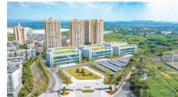
重庆能源职业学院投用的科技园项目