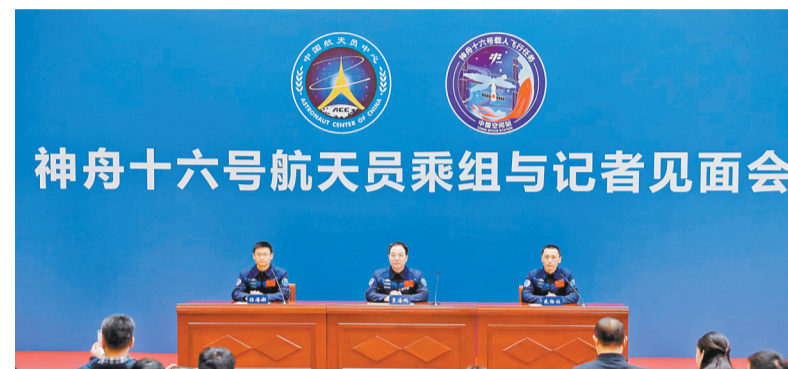
1月19日下午，中国航天员科研训练中心在北京航天城举行神舟十六号航天员乘组与记者见面会。景海鹏、朱杨柱、桂海潮3名航天员从太空返回80天后首次正式公开亮相。