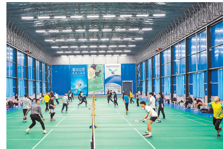
1月18日,市民们在陈家桥体育公园室内羽毛球球馆锻炼。