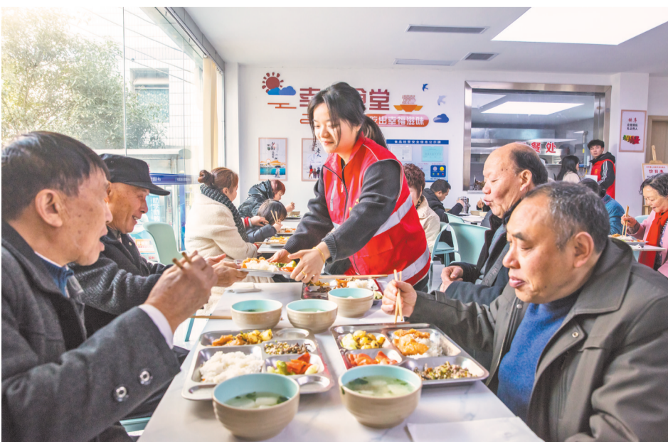
丰都县三合街道平都东路社区老年幸福食堂。

记者从市民政局了解到,在全市层面,去年以来,我市大力发展老年助餐服务。目前,全市累计建设并开展运营的老年食堂有742个(供餐能力50人/餐以上,食堂面积不少于50平方米)、老年助餐点513个。