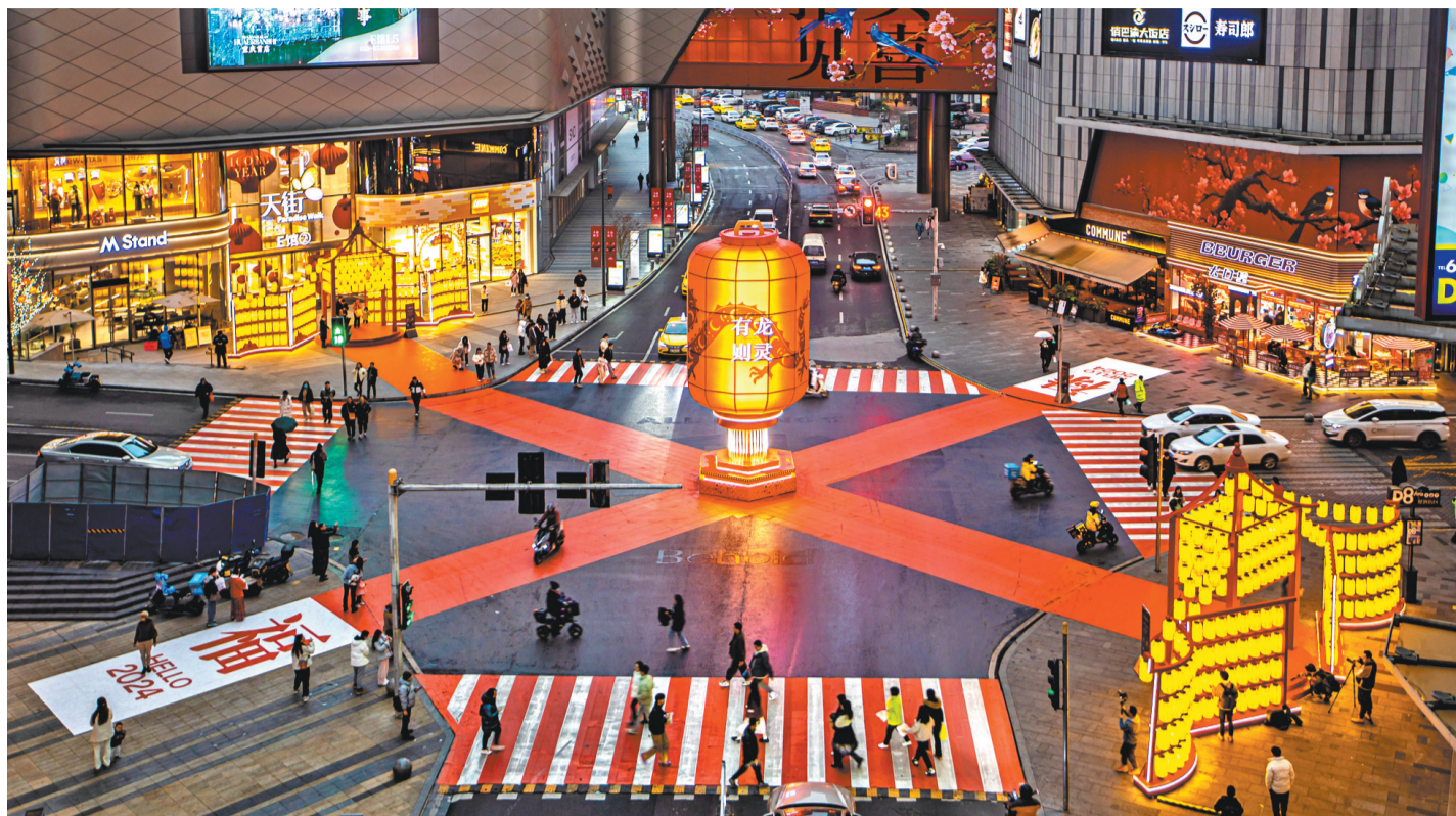
1月16日,渝中区龙湖时代天街十字路口,流光溢彩的龙年灯饰吸引不少市民驻足欣赏。为了迎接新春佳节的到来,我市各地陆续布置出各式各样的灯饰,让市民游客感受到浓浓的节日氛围。

在“文博馆里过大年”板块,推出60余项活动,包括各具特色的主题展览、丰富多彩的文博体验和读书观展活动,拓展春节文