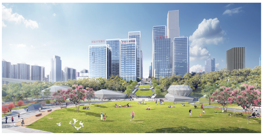
江北嘴金融中心效果图