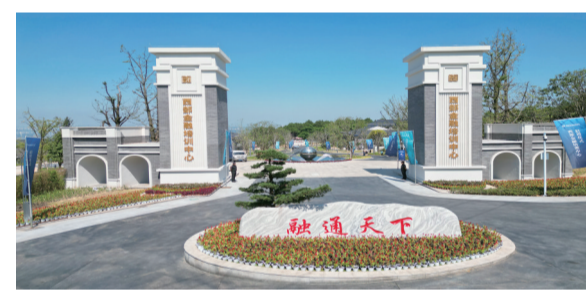
2023年9月6日，西部金融培训中心正式投入使用

扎实推动“三攻坚一盘活”落地见效，江北区将严格贯彻落实市委六届四次全会精神，坚持把国企改革作为在高质量发展中作示范的基础性、先导性工作来抓，秉持“早干晚干都要干的事，早干比晚干好”的理念，主动应变，积极求变，持续深化国企改革，激发发展强大动能。