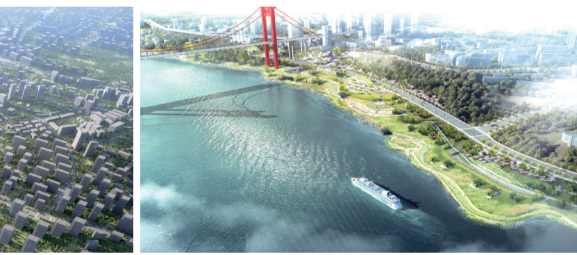
长安三工厂城市更新项目效果图

为做好国资盘活文章，江北区国资委相关负责人介绍，接下来，他们将继续推进行政事业单位经营性资产归口管理，继续分期分批将行政事业单位经营性资产有偿转让给区属国企，深挖闲置资产和市外资产价值，通过整合、调剂、处置、合作经营等方式，研究制定“一户一案”尽快盘活存量资产。 王彩艳 杨敏