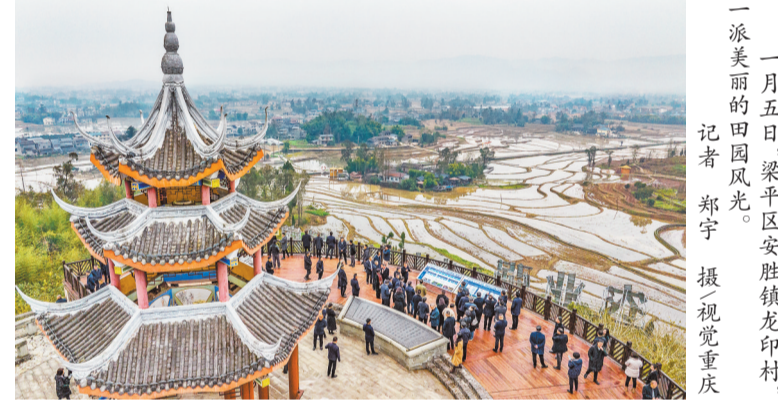
一派美丽的田园风光。