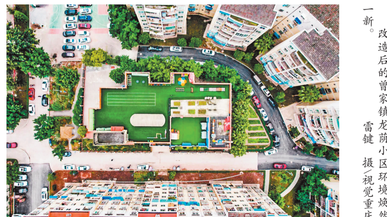
改造后的曾家镇龙荫小区环境焕然一新。