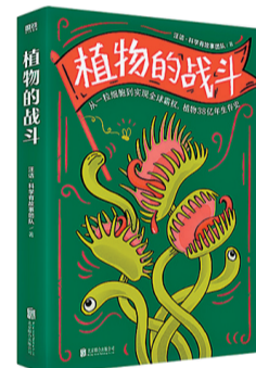
《植物的战斗》 作者：汪诘·科学有故事团队 出版社：北京联合出版公司