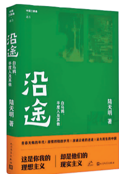
《沿途》 作者：陆天明 出版社：人民文学出版社 重庆购书中心推荐