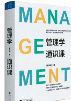
《管理学通识课》 作者：姚余梁 出版社：浙江大学出版社