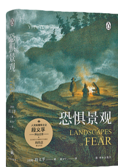
《恐惧景观》 作者：[美]段义孚 译者：徐文宁 出版社：译林出版社 重庆书城推荐