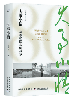
《大事小情：吴季松院士80年记》 作者：吴季松 出版社：原子能出版社/中国科学技术出版社 西西弗书店推荐