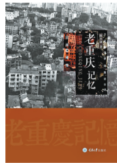
《老重庆记忆》 作者：陈永康 出版社：重庆大学出版社 精典书店推荐