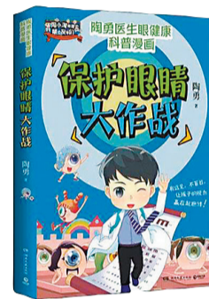
《保护眼睛大作战》 作者：陶勇 出版社：湖南文艺出版社