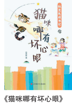
《猫咪哪有坏心眼》 作者：石若昕 出版社：江苏凤凰少年儿童出版社