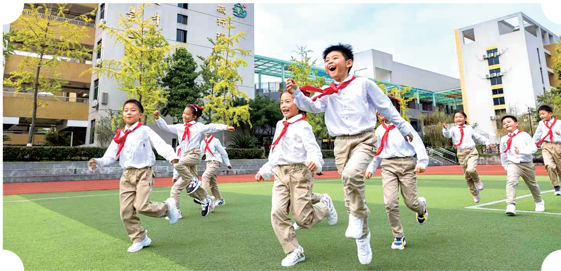
重庆高新区学子朝气蓬勃