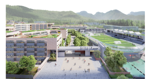
华中师大重庆学校效果图

“优解”的思维，答好义务教育发展的优异“民生卷”。科学城高新区正努力打造以“西部教育高地引领区、教育创新发展先行区、全国智慧教育示范区”为内涵的“西部基础教育特区”，奋笔疾书高位优质均衡的教育新篇，为高质量发展贡献力量。