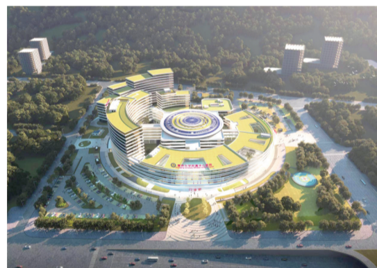
重庆市第四人民医院科学城院区规划图