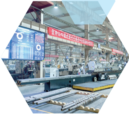
▲重庆水泵厂有限责任公司入选国资委创建世界一流专精特新示范企业名单