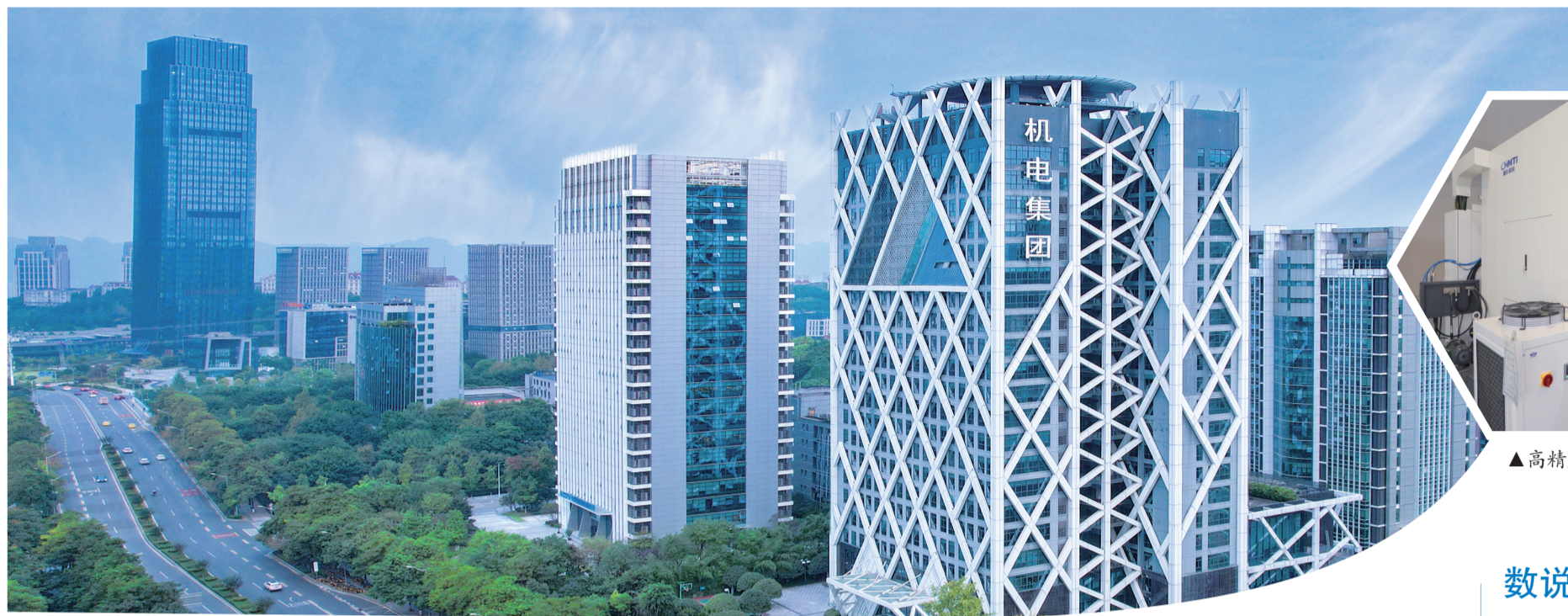
▲重庆机电控股(集团)公司

冬日的山城大地，寒风凛冽，走进重庆机电控股(集团)公司(以下简称“重庆机电集团”)下属企业的各条生产线，热浪扑面，处处迸发着国企改革生机与活力。唯奋楫者先，唯变革者强。作为我市国有资本投资公司改革试点单位，重庆机电集团抢抓国企改革契机，聚焦主责主业，推出系列强有力改革举措，在实现高质量发展新征程中，探索出一条发展方式新、布局结构新、公司治理新、经营机制新的国企发展新路子。