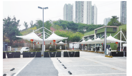
重庆绿能空港乐园充换电站

坚持党的领导、加强党的建设，是国有企业的的光荣传统，是国有企业的“根”和“魂”。