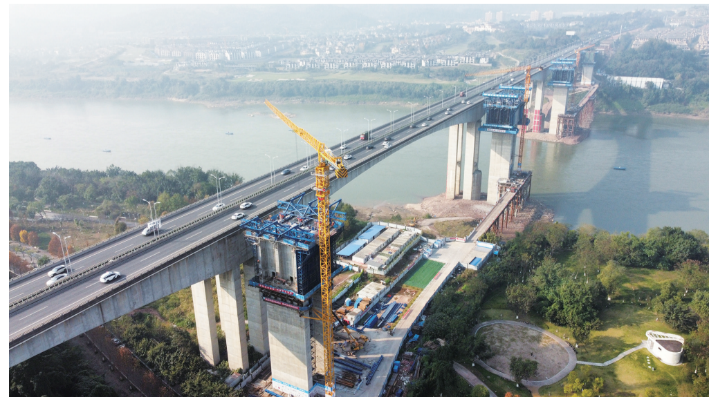
渝武马鞍山复线桥

2023年，重庆市地产集团承担市级重点项目25个，为交出“全年优”高分报表，重庆市地产集团全力以赴、快马加鞭，坚持“每日督办、每周检查”，工程建设任务落实到每周、每日，实施清单化管理，打表推进等多举措加快解决建设过程中遇到的难点和堵点问题。