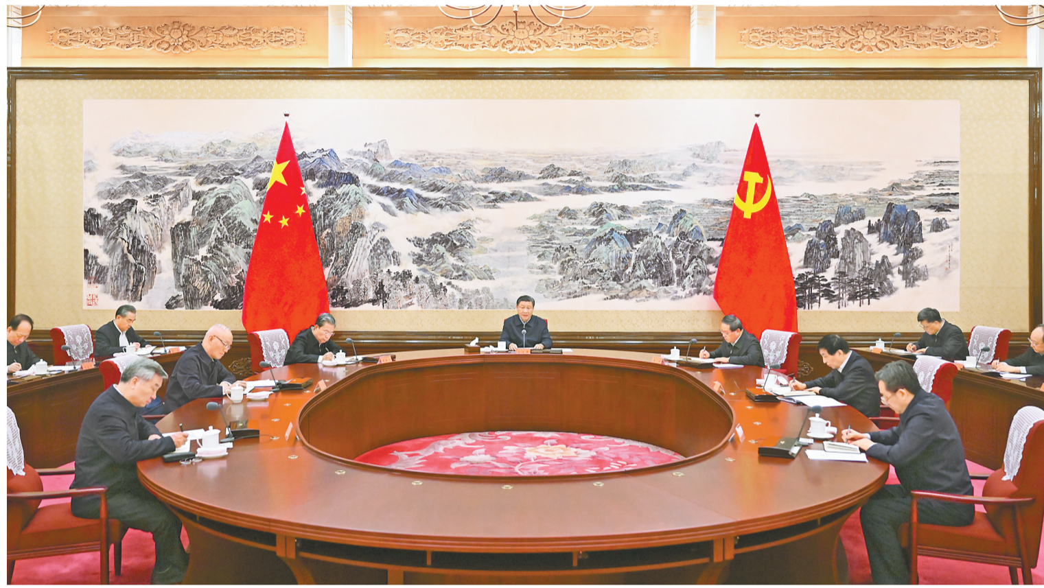
12月21日至22日，中共中央政治局召开学习贯彻习近平新时代中国特色社会主义思想主题教育专题民主生活会，中共中央总书记习近平主持会议并发表重要讲话。