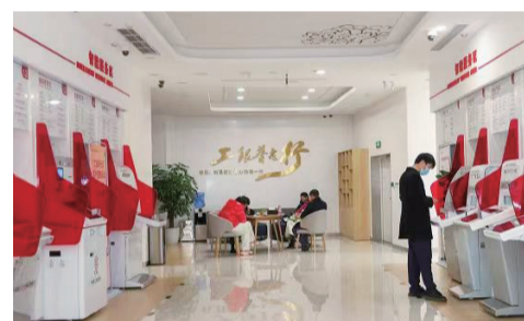
工行重庆市分行智能服务区为民便民

11月17日,工行重庆长寿支行营业大厅内,也发生了紧张又暖心的一幕:一名男子到网点办理业务时,因不明原因突然全身抽搐,