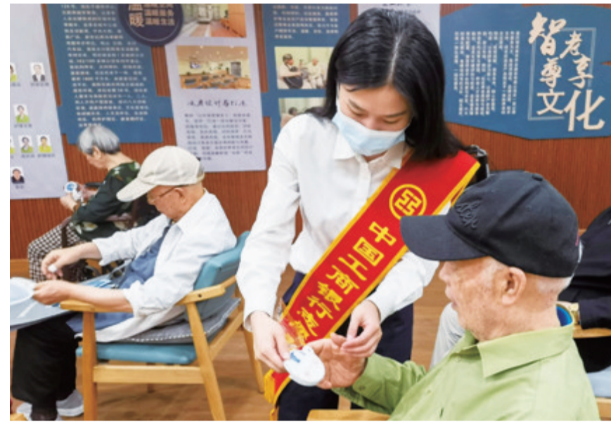
工行重庆市分行工作人员耐心为老人讲解金融知识

金融事业起于为人民服务,兴于为人民服务。2023年,工商银行重庆市分行继续坚持以客户为中心,精准对接客户需求,持续优化贴心暖心服务,不断提升网点服务的广度与深度,充分发挥“工行驿站”品牌纽带作用,将网点打造为更具适应性、竞争力和普惠性的金融服务阵地,助推各项业务持续稳健发展,为增进民生福祉、创造美好生活作出了积极贡献。