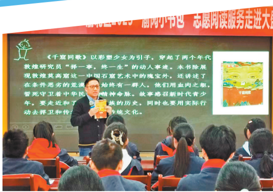
“渝阅小书包”邀请作家走进乡村学校课堂。