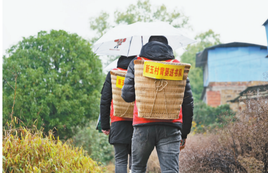
巴南背篓送书队在冒雨送书的路上。