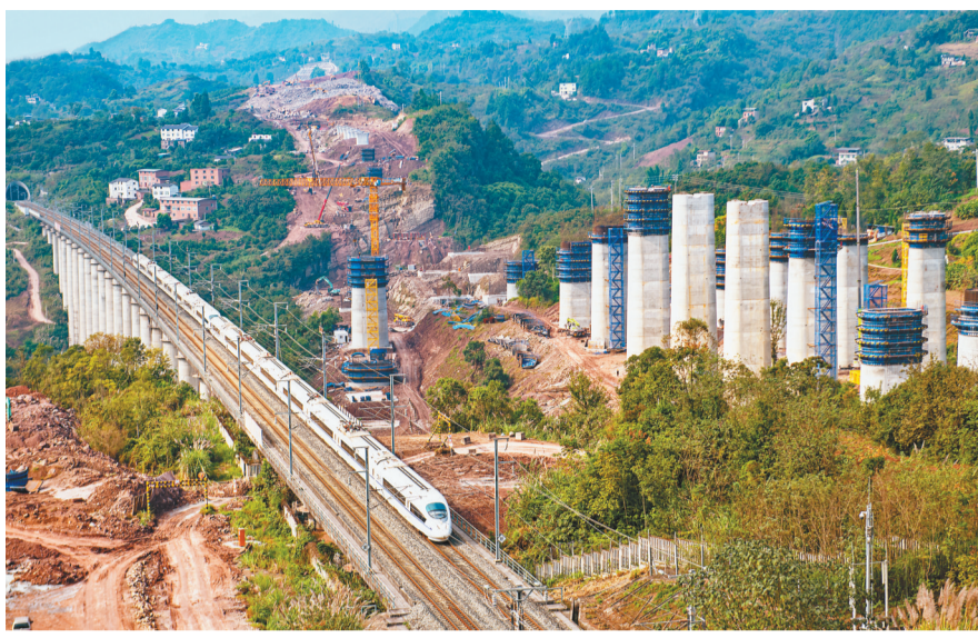
动车飞驰在郑渝高速铁路万州段,建设中的成达万高铁福寿特大桥,渝万高铁柑果村特大桥在此交会。(摄于11月2日)