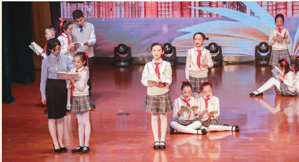
渝中区全域开展青少年读书展示活动

全民阅读蔚然成风，人文渝中充盈书香。让我们走进渝中区，感受浓郁的书香味校园、书香味课程、书香味班级、书生味学生……在阅读中“悦见”这座城市的幸福未来。