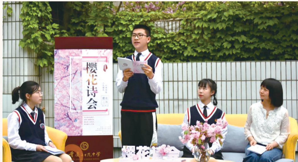
学校开展原创樱花诗会节活动