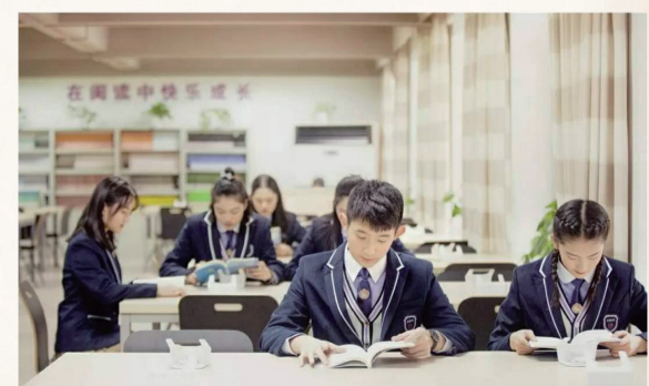
学子们遨游在书的海洋里