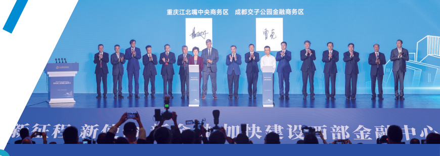
10月24日，在第四届江北嘴新金融峰会开幕式上，江北嘴中央商务区与成都交子公园金融商务区共同发布《共建西部金融中心 赋能双城经济圈建设倡议书》