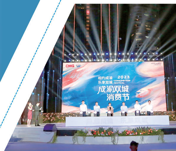
9月27日，“2023成渝双城消费节”在观音桥商圈盛大启幕