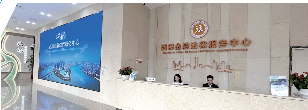
西部金融法律服务中心

有没有一个好的营商环境，归根结底考验的也是政府的社会治理能力。江北坚持“像爱护眼睛一样爱护企业”，推进“百千万”联系服务市场主体全覆盖，做到“有求必应、无事不扰”。推出营商环境最优区10条措施、江北嘴“金10条”“满天星”行动计划10条，升级民营经济高质量发展20条，民间投资机会清单等一揽子优惠政策。今年，江北营商环境测评蝉联全市第一，是中心城区唯一一区上榜全市优化营商环境标杆城市。