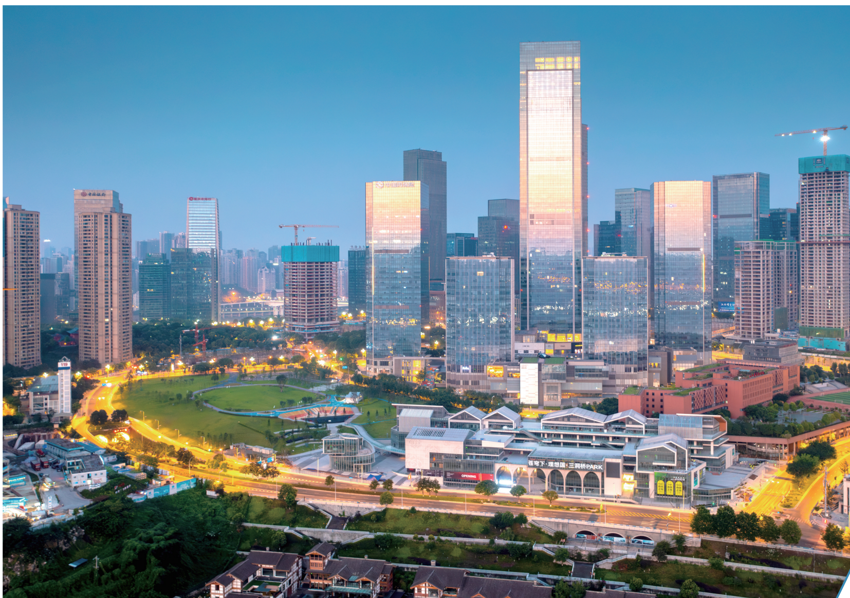
江北嘴中央商务区