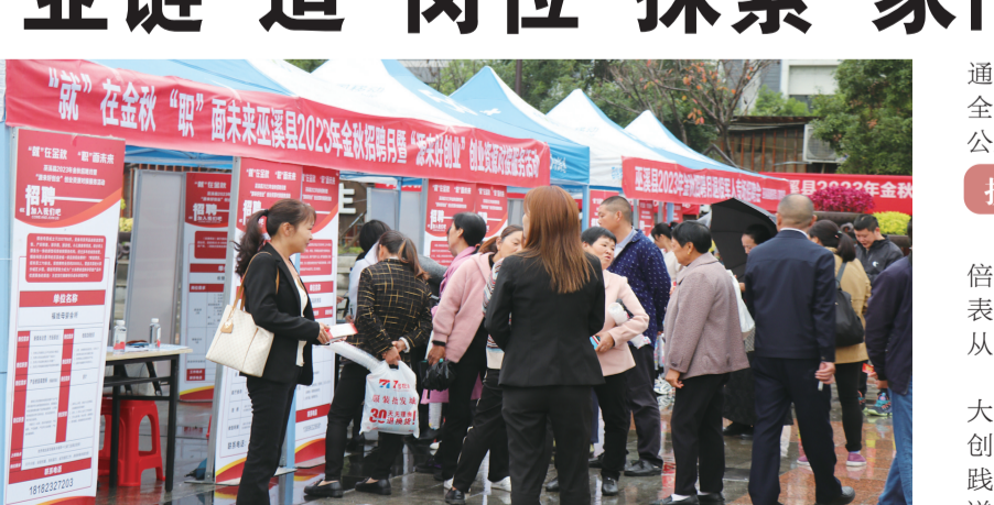
巫溪县2023年金秋招聘月活动吸引众多求职者

完善的就业服务体系是促进各类群体高质量充分就业的重要保障。今年以来，巫溪县人社局完成