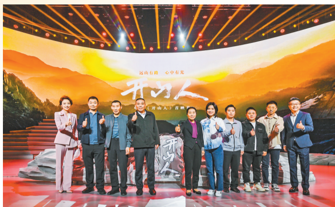
十一月十四日,电影《开山人》首映礼现场(资料图片)。