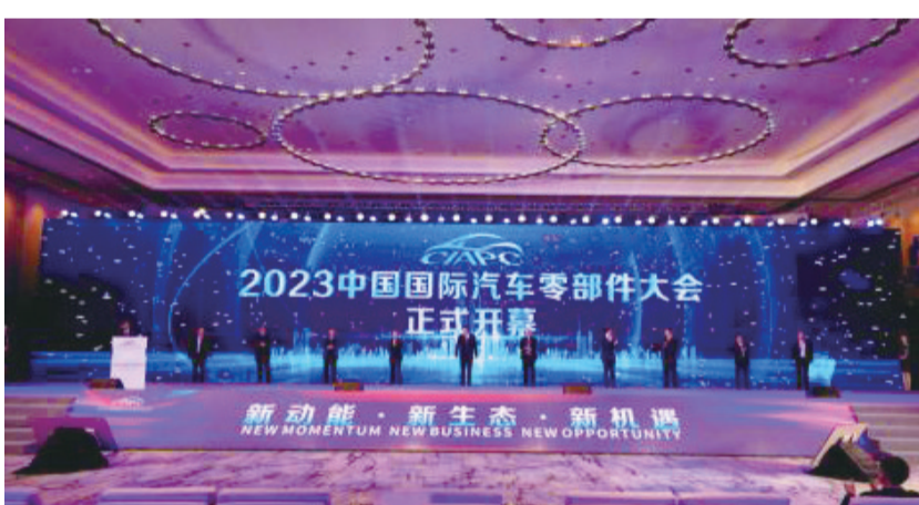
2023中国国际汽车零部件大会开幕式现场

示,广安作为成渝地区双城经济圈建设国家战略前沿、改革前沿,正加快迈向高质量发展。