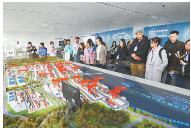
12月7日,留学生在内陆国际物流枢纽展示中心参观。

“留学生看重庆”活动始于致公党北碚区委于2018年发起的“留学生看北碚”海外联谊活动。“通过这样的近距离参观体验活动,有助于让广大外国留学生全面了解重庆的高质量发展相关成就。”致公党北碚区委主委胡昌华表示,希望留学生们学成回国后,成为重庆与当地沟通交流的桥梁,为加强重庆乃至中国与各国的经贸和文化交往贡献力量。