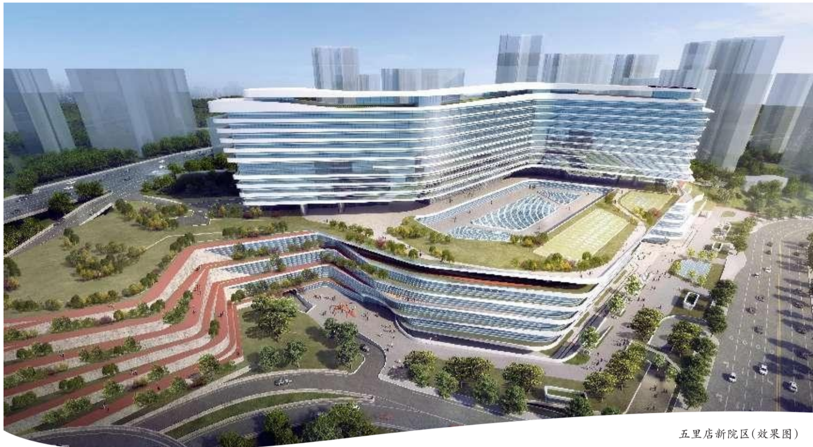
五里店新院区(效果图)

糖尿病“综合管家”正式上线、“就医服务一件事”改革成果显现、自编自导诗歌朗诵《爱莲说“廉”》广受好评……今年,重庆市红十字会医院(江北区人民医院)坚持高位推进、高效落实、高点谋划,全面提升学科实力、优化服务、加强清廉医院建设,努力为群众提供更加优质高效的健康服务。