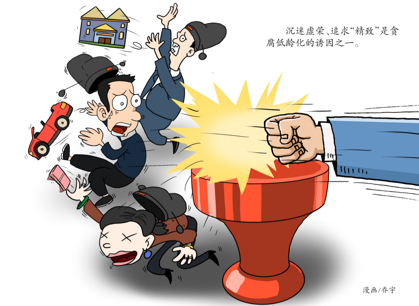
沉迷虚荣、追求“精致”是贪腐低龄化的诱因之一。