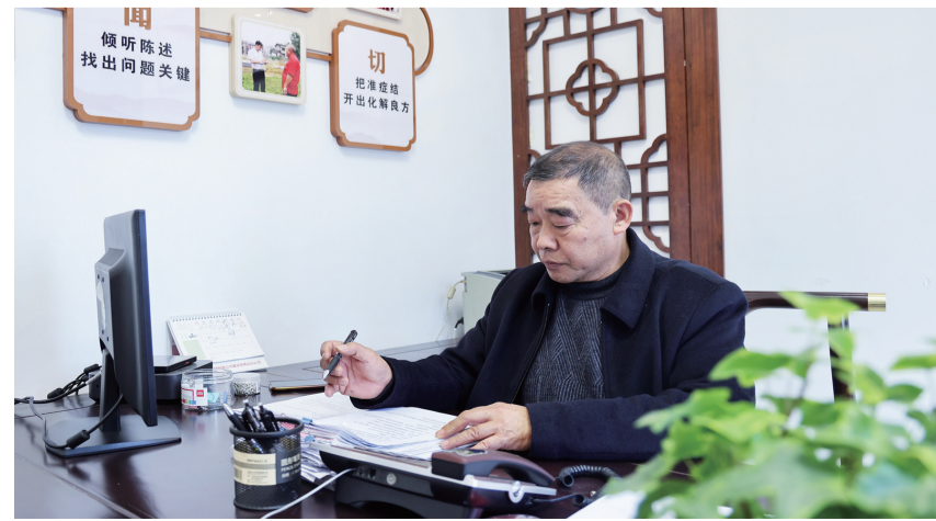
老田翻看案件卷宗