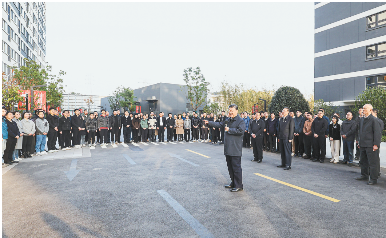
在上海期货交易所考察。中央军委主席习近平在上海考察。这是十一月二十八日下午,习近平在闵行区新时代城市建设者管理者之家考察。这是十一月二十九日下午,习近平在闵行区新时代城市建设者管理者之家,同社区居民亲切交流。