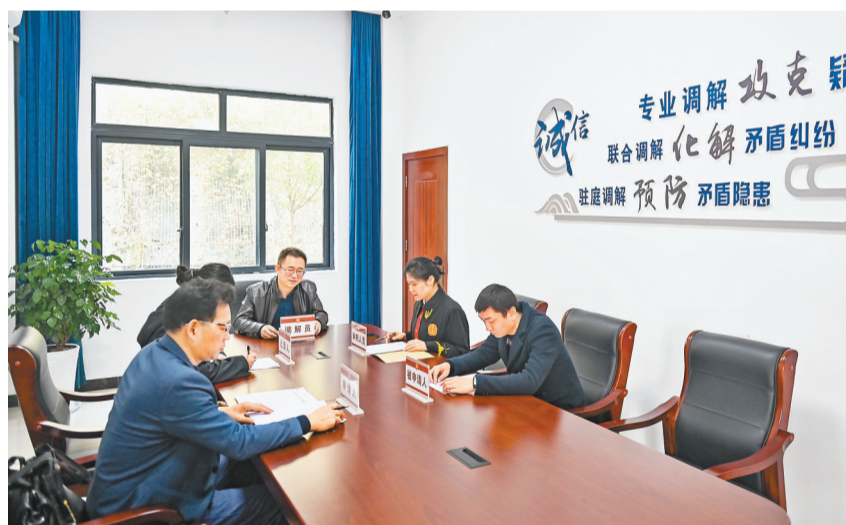
11月28日，江津区“福商”调解室内，商事调解员正在进行调解。

与曹鹏想法不谋而合的，还有江津区工商联。“双福新区商会作为新区经济发展的纽带，现有会员单位300余家，涵盖了汽车、科技、新能源和电子等制造业，批发零售、道路运输、房地产、酒店、餐饮等商贸服务行业。”邹茹表示，如果能将商会的力量充实到商事纠纷化解中，让商事纠纷化解在“对簿公堂”之前，则