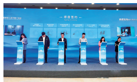
11月10日,“2023建行全球撮合节”——“渝建陆海”重庆西部陆海新通道主题活动暨跨境人民币推介活动成功举办。

“建行全球撮合节是建设银行为推动全球产业链供应链稳定、促进国际贸易畅通而举办的系列主题活动,旨在通过‘境内外机构集中资源、境内外企业集中对接、境内外商机集中展示’,以新金融方式助力企业高效达成更多跨境合作意向与订单。”据建行重庆市分行相关负责人介绍,本次活动为“2023建行全球撮合节”系列活动的第三场,目的在于助力西部陆海新通道发