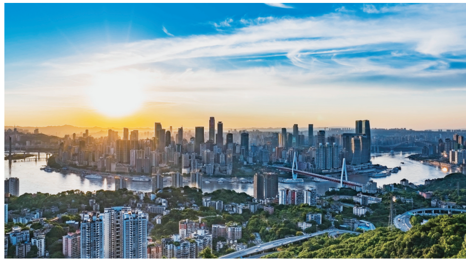
建行重庆市分行全力支持西部陆海新通道建设