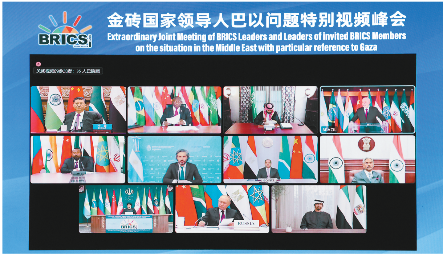
11月21日晚,国家主席习近平出席金砖国家领导人巴以问题特别视频峰会并发表题为《推动停火止战 实现持久和平安全》的重要讲话。

新华社北京11月21日电 11月21日晚,国家主席习近平出席金砖国家领导人巴以问题特别视频峰会并发表题为《推动停火止战 实现持久和平安全》的重要讲话。(讲话全文见2版)