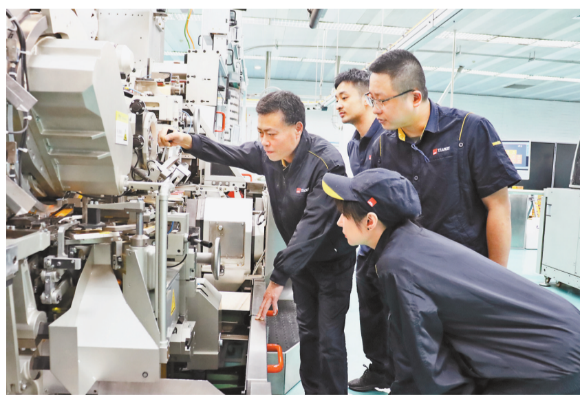
“师徒”培训操作高速设备

党建引领起到了重要作用。高新设备项目组成立伊始,工厂便精选来自“天子”突击队、“集电”攻坚小组的党员骨干组建专业团队,开展专项攻坚,全力协同上海、常德、许昌烟草机械调试人员一起干一起拼。