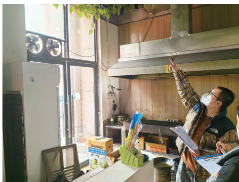
云篆山水项目“瓶改管”燃气公司进行入户现场勘察

为确保民生工程推进力度，由各级部门共同推进的工作机制逐步形成：由重庆市应急管理局统筹安排，市经济信息委负责燃气改造工作的业务统筹协调和安全监管；市规划自然资源局、市住房城乡建委、市城市管理局等部门在行政审批方面给予政策指导；各区安委办负