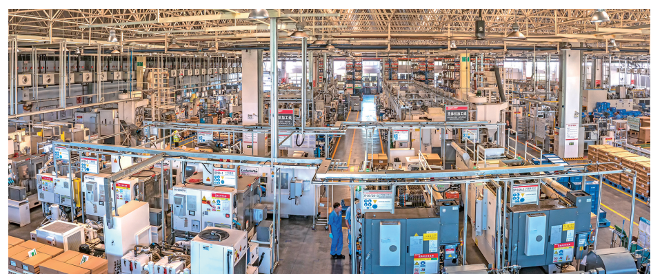
2016年重庆耐世特转向系统有限公司由苏州搬迁至江津德感工业园，如今年产值已达13亿元

油溪新型建材中小企业集聚区： 围绕新型建材产业，以水泥基产品为基础，向建筑骨料、干粉砂浆商品混凝土、预制构件等延伸产业链条，加快传统企业提档升级，向节能、环保、再利用方向拓展。