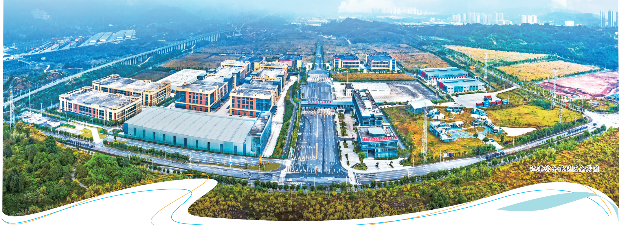
江津综合保税区全景图