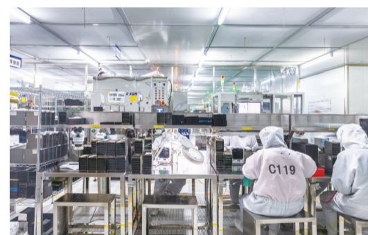
天实精工摄像头生产线