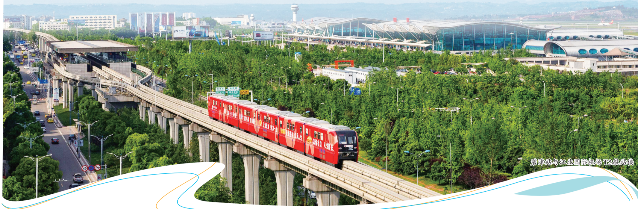
碧津站与江北国际机场T2航站楼

渝北是重庆的工业大区、工业强区。从2004年以来,渝北连续19年工业产值规模位居全市区县第一位。目前,渝北正积极发挥作为重庆全市的“高水平开放主阵地、高质量发展主引擎、现代化国际大都市主客厅”战略地位作用,通过持续加快建设先进制造业核心区、现代服务业集聚区、教育科技强区,主动扛起大区责任,全力以赴拼经济、奋勇争先挑大梁,在现代化新重庆建设中展现大区担当、实现大区作为。